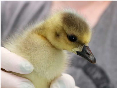
Grauw Gansje (boven) en jonge Kraaien (onder)