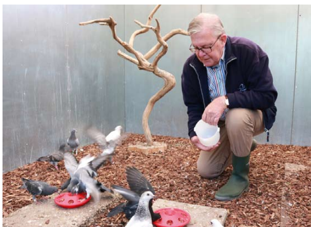
Diana ter Braak maakte een fraaie fotoreportage in ons Vogelhospitaal in het kader van 'In The Picture - vrijwilligerswerk in beeld'.