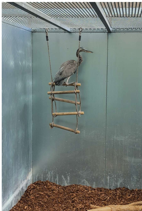
Jonge reiger gaat de boom in

informatie https://www.vogelhospitaal.nl e-mail management@vogelhospitaal.nl telefoon 023 525 53 02 adres Vergierdeweg 292 2026 BJ Haarlem