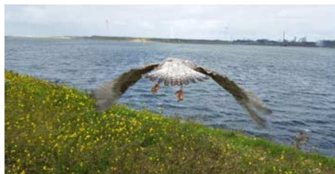
De zilvermeeuw is de meest gebrachte vogel in 2017, met een ruime 300 vogels tot nu. Dit exemplaar is zojuist vrijgelaten.

Onze drukste maanden zijn juni en juli, dan moeten we alle zeilen bij zetten om het te redden en werken we in ploegendiensten om alle jonge vogeltjes van 's morgens tot 's avonds te blijven voeren. Afgelopen juni was de drukste maand met 671 vogels.