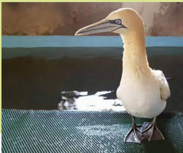
Jan van Gent bij de watertafel in het badhuis

Wist u dat als u een periodieke schenkings-overeenkomst met ons afsluit, uw giften volledig aftrekbaar zijn in Box 1 van de inkomstenbelasting? Door deze aftrek ontvangt u al snel een derde tot de helft van uw gift van de belastingdienst terug. Een jaarlijks vast bedrag en een minimum looptijd van 5 jaar zijn voorwaarden van de belastingdienst. Het afsluiten van de overeenkomst is gratis, een notariële akte is niet meer nodig.