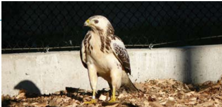
Buizerd in de vliegkooi

Like ons op Facebook en blijf op de hoogte! https://www.facebook.com/HetVogelhospitaal